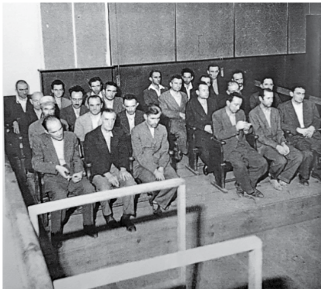
Gjyqi i Deputetëve, grupi i parë, Salla, kinema Nacional